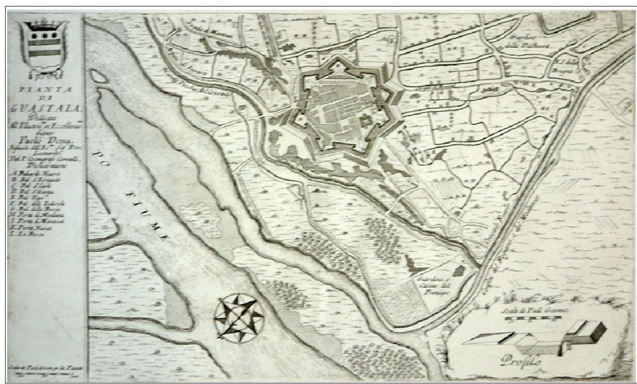
Tav. 4.1 - CENTRO STORICO DEL CAPOLUOGO - VARIANTE 2005

REGOLAMENTO URBANISTICO EDILIZIO (L.R. 24 marzo 2000, n.20 - art.28)