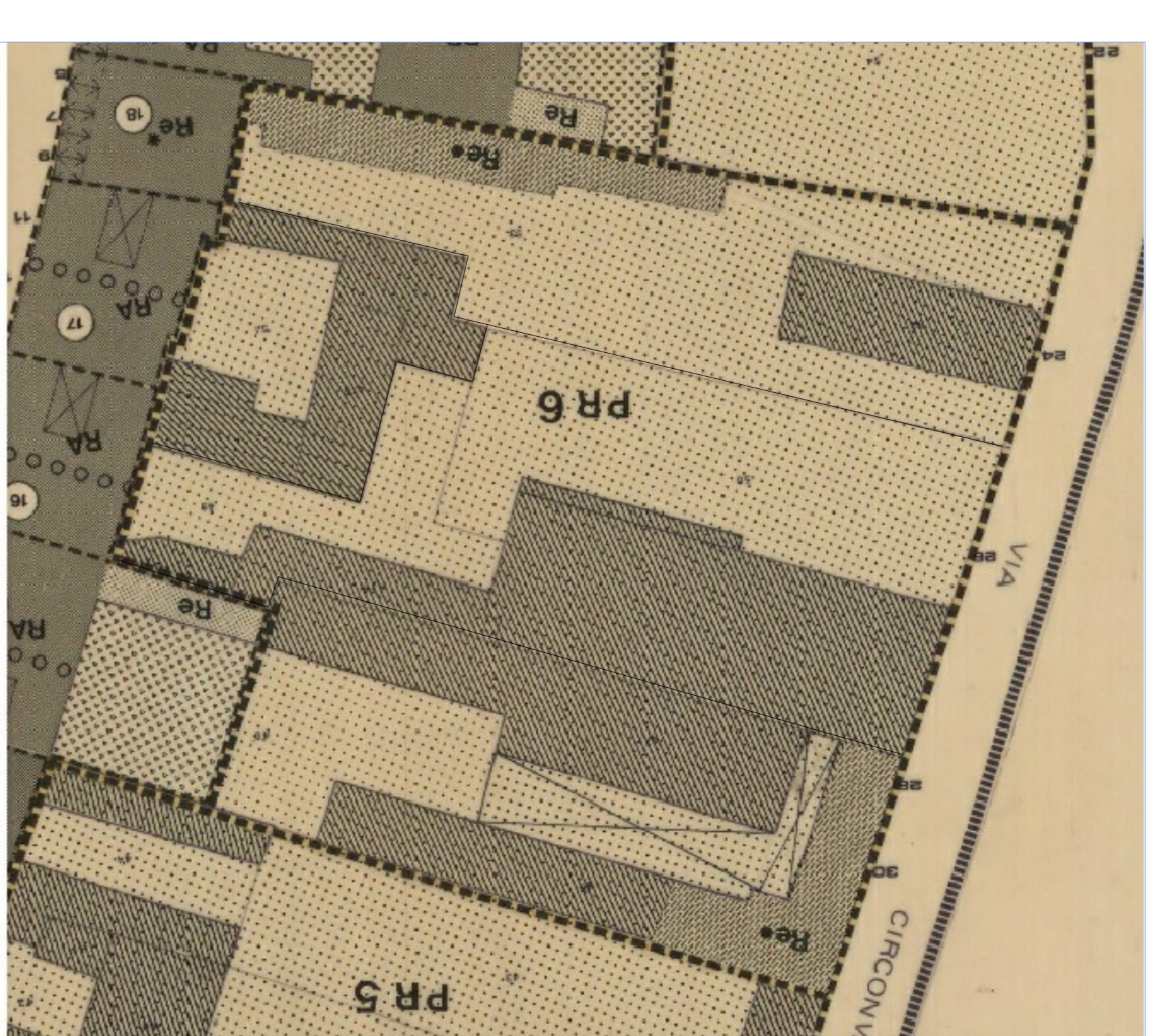
ESTRATTO DI MAPPA PR6 DA RUE, scala 1:500 STATO ATTUALE