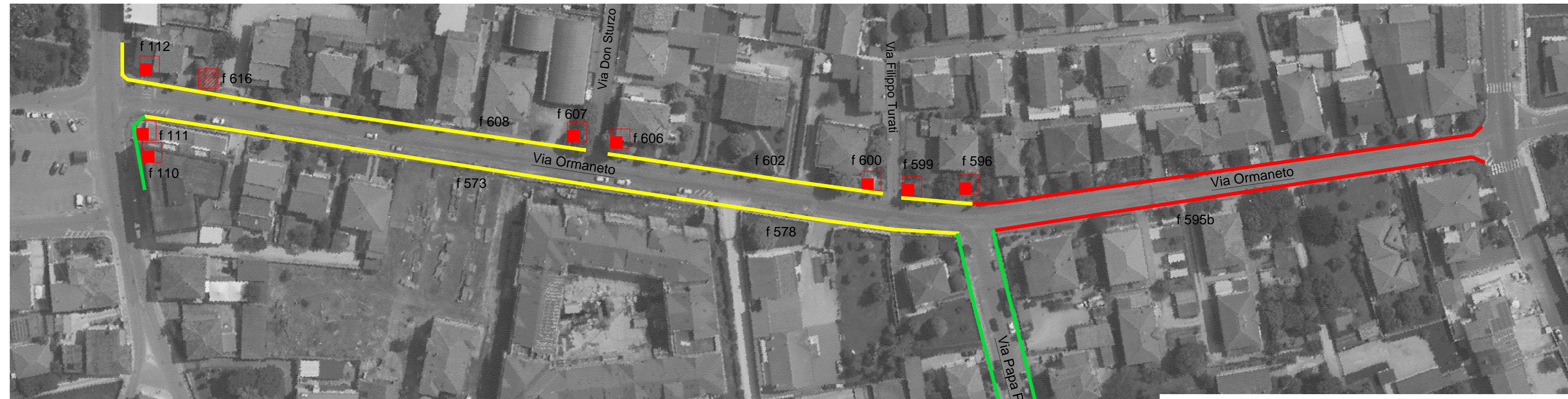
ELENCO CRITICITA' codice immagine - descrizione problematica