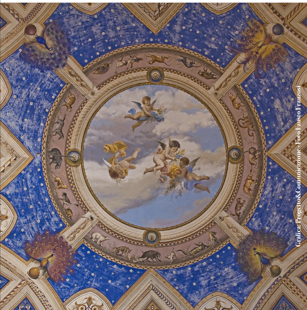
Grafica: Progetto & Comunicazione