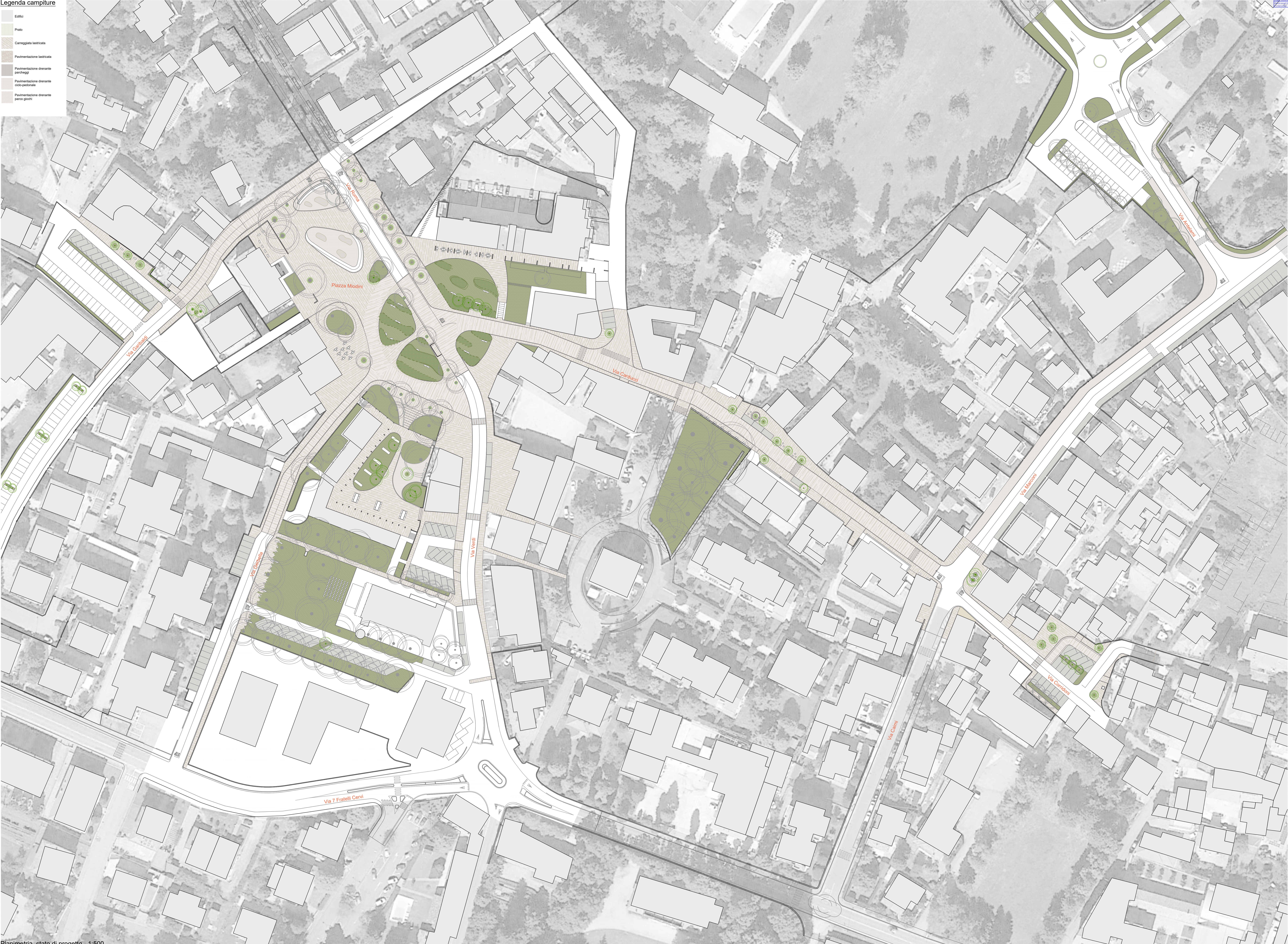
Planimetria, stato di progetto - 1:500