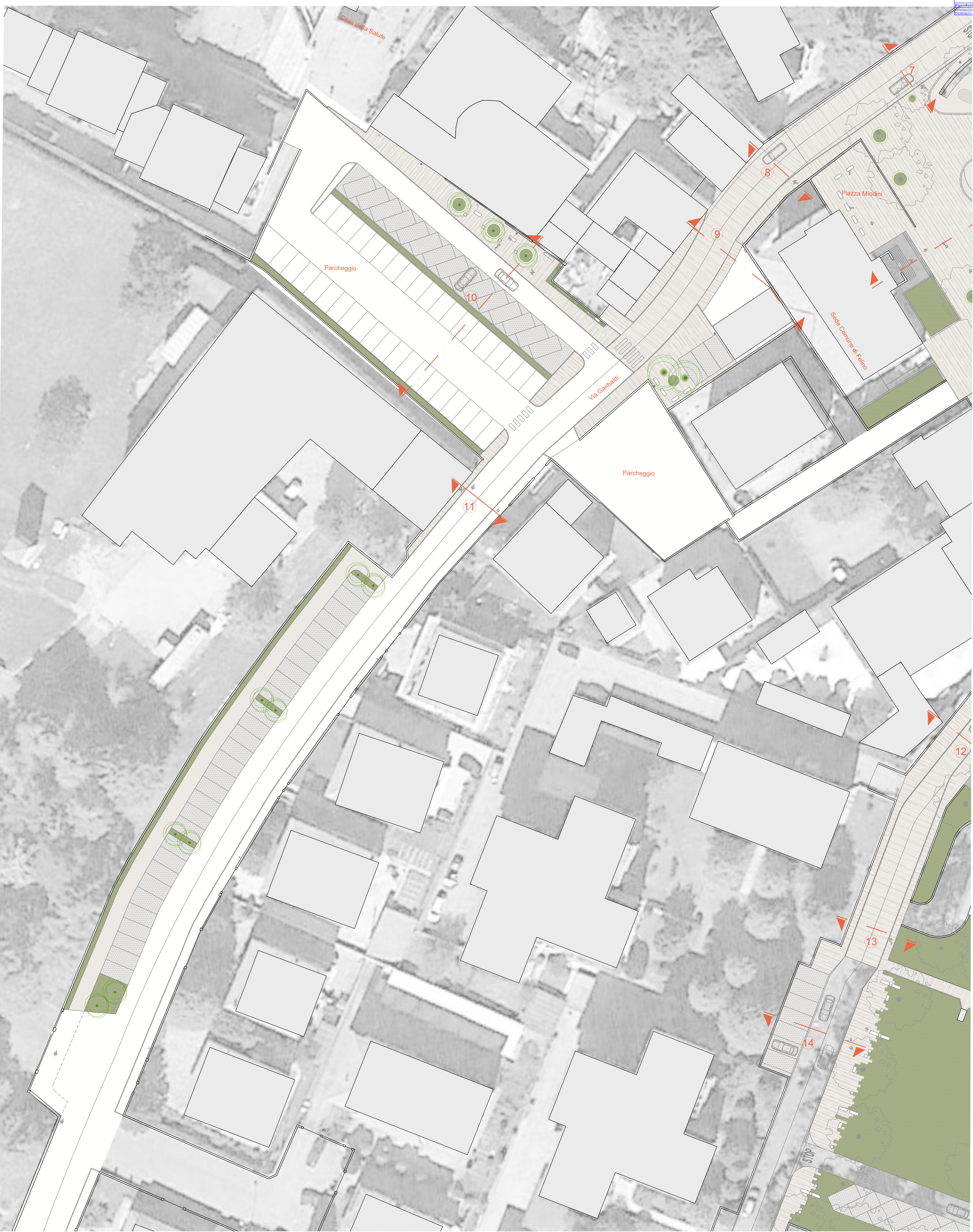
Planimetria, stato di progetto - 1:250