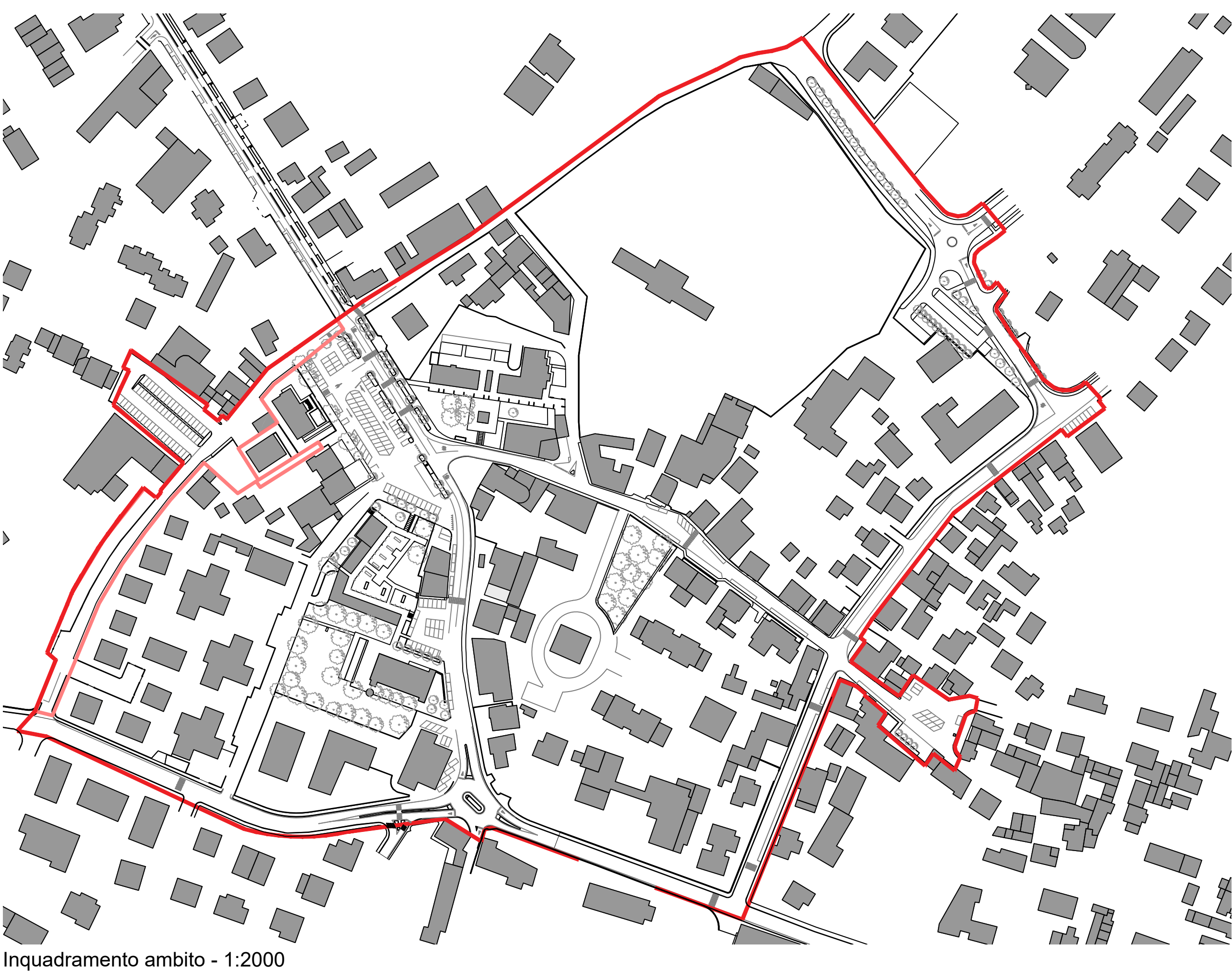
Inquadramento ambito - 1:2000