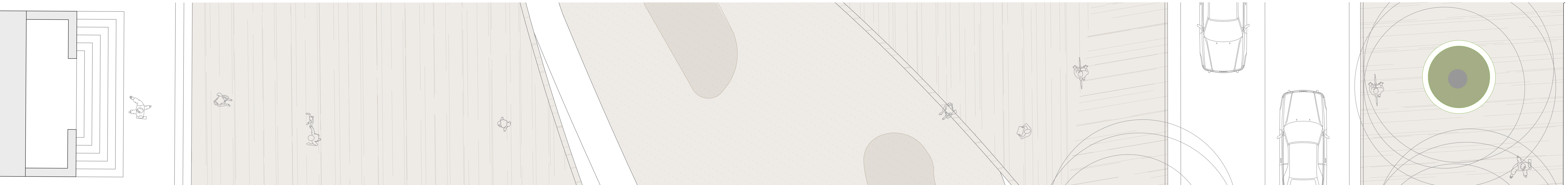
Zoom 1, progetto - 1:50