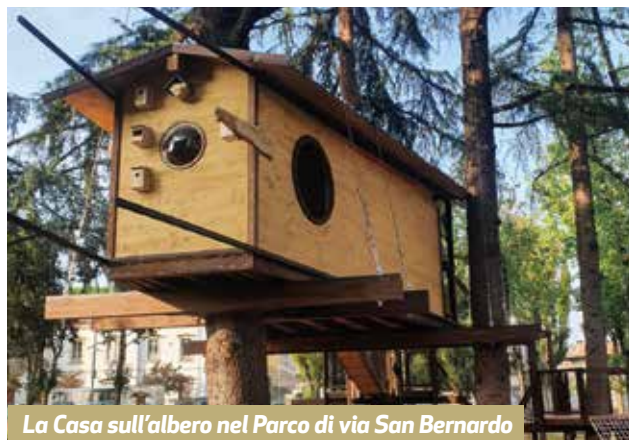
La Casa sull'albero nel Parco di via San Bernardo

La cornice è il bilancio comunale: un impegno solido e importante, rafforzato dalla significativa variazione di bilancio di maggio che destina ulteriori risorse con oltre 5 milioni 470mila euro che vanno ad aggiungersi ad un bilancio che muove già risorse per 50 milioni di euro. Tra gli interventi che troveranno spazio, quelli di manutenzione straordinaria ad uno dei gioielli della città: il Parco Borromeo, con un impegno di 270 mila euro che servirà per riqualificare il Giardino e le sue meraviglie. L'Amministrazione finanzia investimenti per quasi 5 milioni di euro, incrementando le risorse per gli incarichi professionali. Quest'ultima è una novità assoluta almeno in tale entità: oltre 500mila euro per le consulenze necessarie per interventi attesi da tempo. Tutto questo lavoro consentirà di far partire i bandi di gara relativi ai progetti e alle manutenzioni straordinarie previste dal programma elettorale per scuole, strade, piazze e aree pubbli-