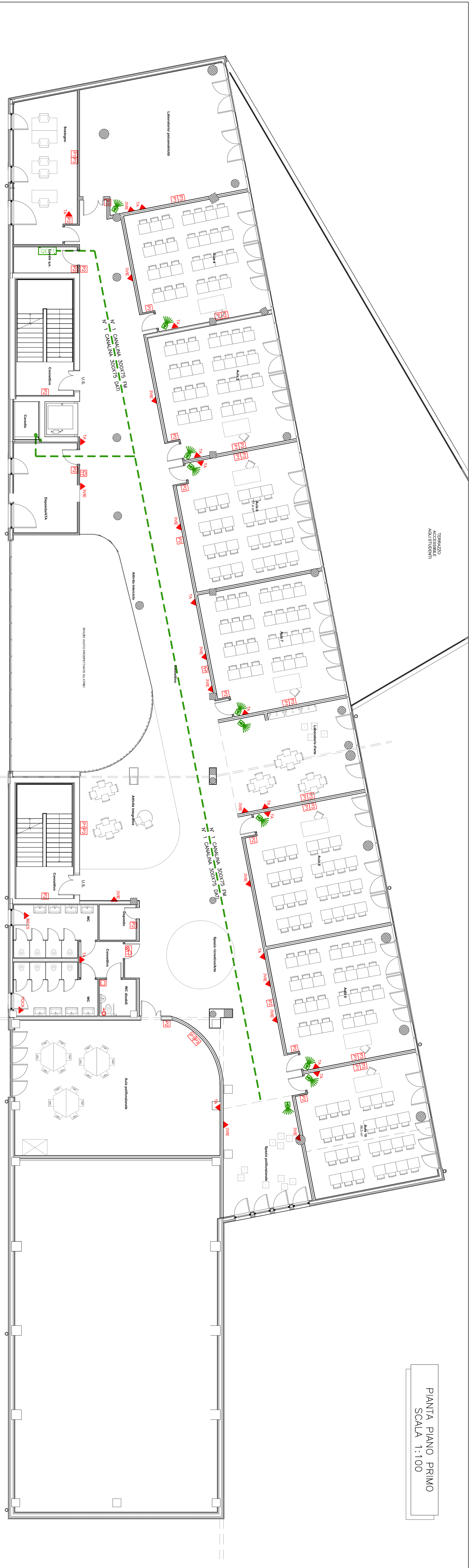
PIANTA PIANO PRIMO SCALA 1:100

NOTA: 1) SARANNO INSTALLATE TUTTE LE TUBAZIONI E LE SCATOLE DI DERIVAZIONE NECESSARIE PER REALIZZARE LE OPERE SECONDO LE INDICAZIONI DELLE NORME E LEGGI IN VIGORE; 2) LA TIPOLOGIA E LA SEZIONE DEI CONDUTTORI PER L'ALIMENTAZIONE DELLE VARIE UTENZE E RAFFIGURATA NEGLI SCHEMI UNIFILARI ALLEGATI; 3) I PARTICOLARI COSTRUTTIVI PRESENTI NELLA PRESENTE TAVOLA SONO ESCLUSIVAMENTE A SCOPO ILLUSTRATIVO; 4) PER LE ALTEZZE DELLE PRESSE, INTERRUPTORI E TUTTE LE UTENZE ELETTRICHE FARE RIFERIMENTO ALLA NOMINATIVA CEI 6480 - CEI 6480 E LA TAVOLA DEI PARTICOLARI COSTRUTTIVI.